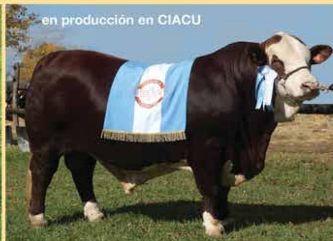
RP R2895 GRAN CAMPEÓN EXPO NACIONAL 2014