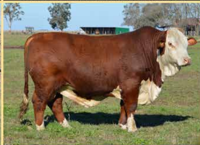
MOROPAMPA R2485 APACHE