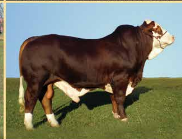
R 1743 CAMPEÓN EXPO BRA 2013