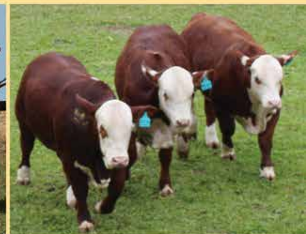
CAMPEÓN CONJ. TERNERO EXPO NACIONAL 2014