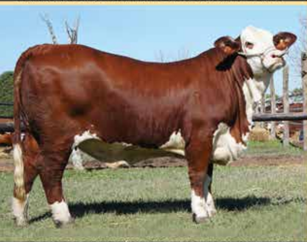
RP R 6506 CAMPEÓN VAQ. EXPO NACIONAL 2013