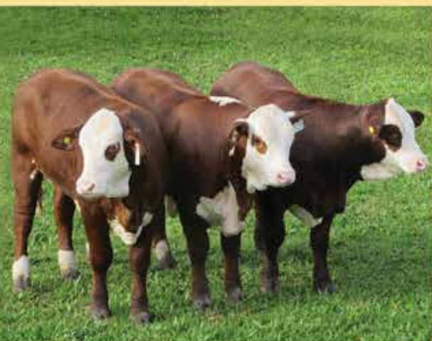
RDO. CAMPEÓN TERNERA EXPO NACIONAL 2013